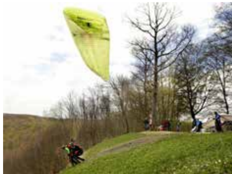
Alles was fliegt

Seit die beiden Startplätze mit dem Segen des Landratsamtes so präpariert werden konnten, dass auch Gleitschirme ohne Probleme in die Luft kommen, wurden die Drachen am Himmel über Beuren und Neuffen immer seltener;