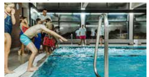
Der Startschuss ist gefallen – die Sanierung der Kleinschwimmhalle kann losgehen!

In der Aussprache der Gemeinderäte wurden viele Argumente aufgezählt, die für den Erhalt der Kleinschwimmhalle vor allem aus Sozial-, Bildungs- und dem Gesundheitsaspekt heraus motiviert waren. So wurde klargestellt, dass die Schwimmhalle eine wichtige Institution darstellt, wenn es um das Erlernen des Schwimmens und den Erhalt der Gesundheit im Alter geht. Wiederum kritisch wurde die Finanzierung der Maßnahme gesehen, wobei sich insbesondere die Kritik von Bürgermeister Glibber hier an das Land richtete, da hier keinerlei Unterstützung gekommen sei. Letztendlich wurde die Sanierung als finanzielle Last für die Gemeinde Beuren eingeordnet, deren Vorteile und Nutzen jedoch überwiegen . Die Entscheidung ist entsprechend einstimmig, bei zwei Enthaltungen, gefallen.