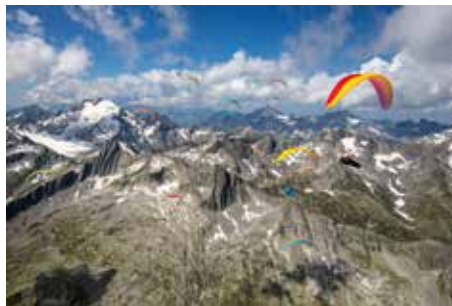
Heinrich Bretz beim World Cup (Schweiz)

heute bestimmen die Gleitschirme das Bild über der Alb. Mehr als 300 Vereinsmitglieder des DCH, 300 Mitglieder unserer Partnervereine TVB und DGCW und 600 Gastpiloten gehen mehr oder weniger regelmäßig von den beiden Startplätzen in die Luft. Ganz erstaunlich sind die Strecken, die in der Zwischenzeit mit den Gleitschirmen geflogen werden. Flüge zum Bodensee erregen längst keine Aufmerksamkeit mehr.