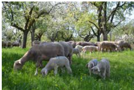
Den Schafen des Freilichtmuseums Beuren geht es an den Schäfertagen am 20. und 21. April an die Wolle.

Seit Jahrhunderten prägt die Schafhaltung die Kulturlandschaft auf der Schwäbischen Alb. Die Schäfertage im Freilichtmuseum Beuren rücken am kommenden Wochenende, 20. und 21. April, die wolligen Alleskönner in den Mittelpunkt. Bei den 23. Schäfertagen am Fuß der Schwäbischen Alb sind zudem besondere Schafassen zu Gast.