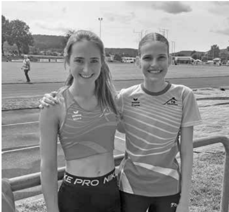
Zwei zufriedene Neuffenerinnen

Nina kam im Hochsprung ebenfalls auf 1,40m und wurde damit Regionalmeisterin der Leichtathletik-Region Achalm. Im Weitsprung standen für sie 4,43m zu Buche.