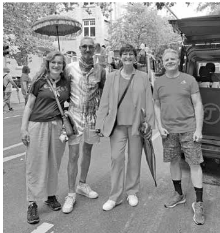
Saskia Esken MdB auf dem CSD

MdB Dr. Nils Schmid - Unser Abgeordneter in Berlin Wahlkreisbüro, Bahnhofstr. 8, 72622 Nürtingen Tel. 07022 / 21 19 20 Fax 07022 / 21 10 83 Mail: wahlkreis@nils-schmid.de