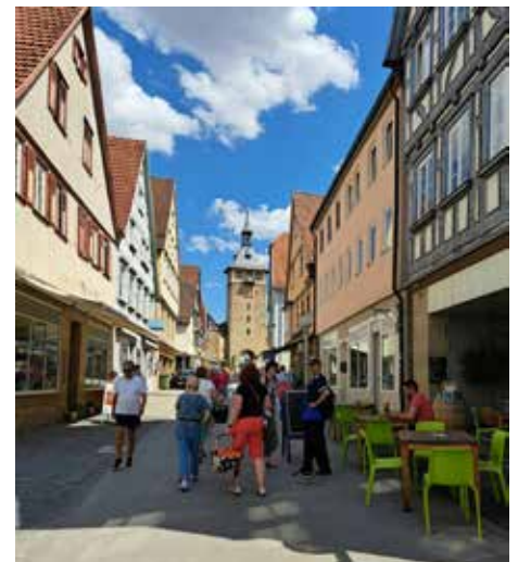
In Marbach wurde das Zentrum ausgiebig erkundet