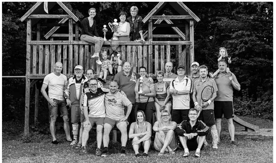
Hier die beiden Endspiel-Mannschaften der TA TB Neuffen und TA SSF Kappishäusern in freundschaftlicher Einheit!