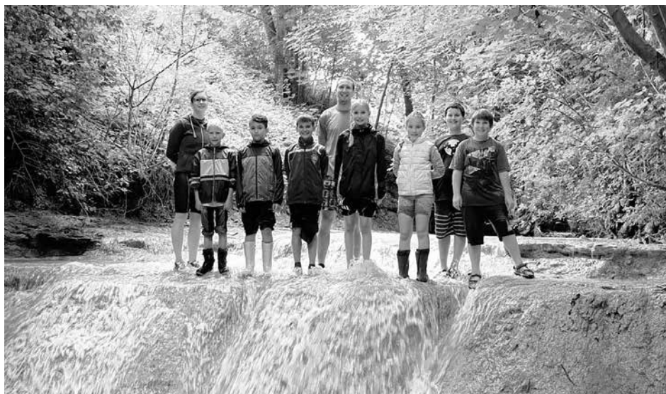
7 unerschrockene Kinder und die DLRG-Betreuer bei der Wanderung durch die Steinach im Rahmen des Sommerferienprogramms

Nach einem kurzen Kennenlern-Spiel wagten wir dann auch den Einstieg unterhalb des Neuffener Feuerwehrmagazins. Auf Grund der Temperaturen um die 20°C mussten wir unser Programm etwas anpassen, sodass wir im Bach wirklich nur wandern konnten und der Badeanteil entfallen musste. Auf unserer Reise bis kurz vor Hummels Mühle in Linsenhofen entdeckten wir die schöne Natur des Baches, mussten einige Was-