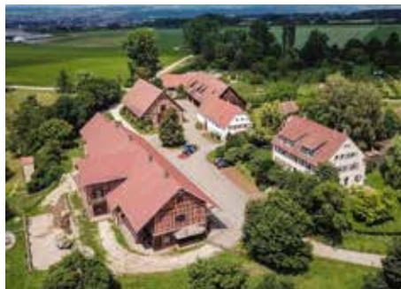
Luftbild Tachenhausen Hofgut

Die HfWU lädt am 22. Juni auf ihren Lehr- und Versuchsbetrieb Hofgut Tachenhausen ein.