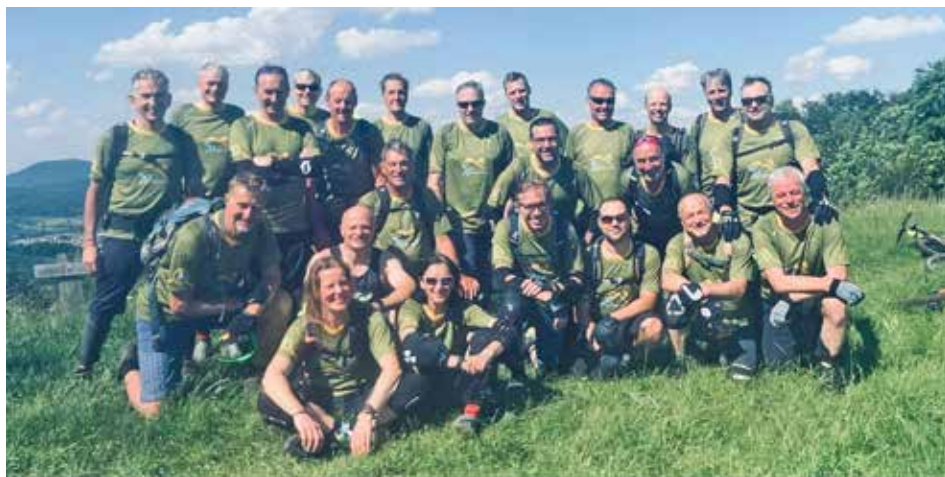
Das Bild zeigt die Gruppe der 22sten Tour des Jahres oberhalb von Donzdorf