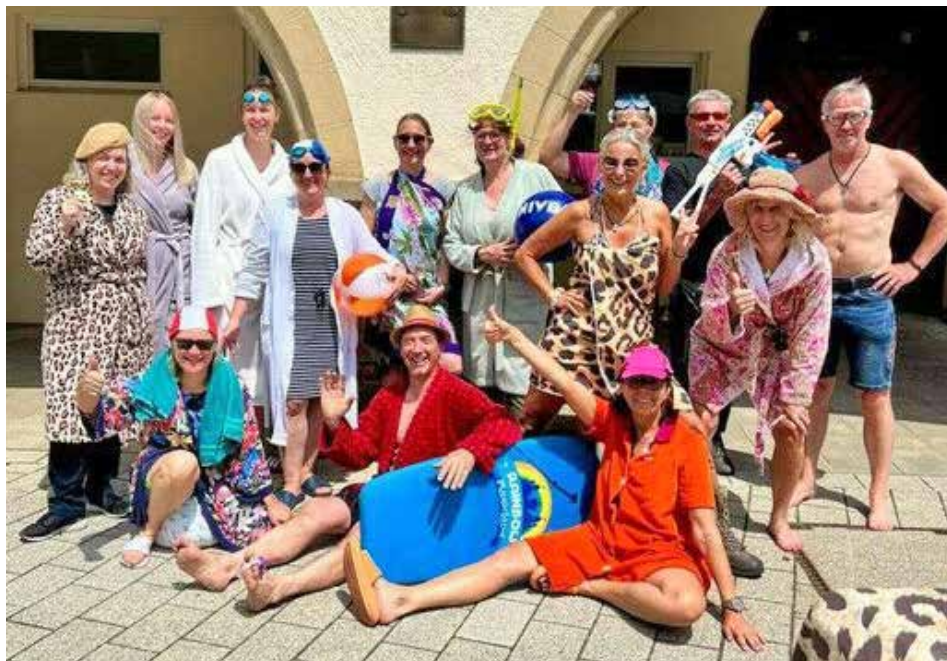
Fotoshootingtermin vom 8. Juni - mit Spaß dabei

Teilnahme nur mit angezogenem Bademantel - der Rest vom Outfit ist frei(gestellt) - bestes Outfit wird prämiert - weiter Infos folgen ... ds