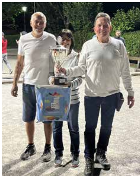
Sieger Hobbyturnier 2014: „Schlitzohren“

Sieger des diesjährigen Hobbyturniers wurden die „Schlitzohren“ mit 4 Siegen und 52:15 Punkten vor „WCC“ mit 4 Siegen und 52:24 Punkten. Sehr guter Dritter wurde „Eins, Zwei, Drei Bier“ mit 4 Siegen und 52:28 Punkten.