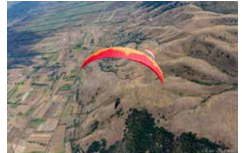
Über den Hügeln von Krushevo (Nord-Mazedonien)