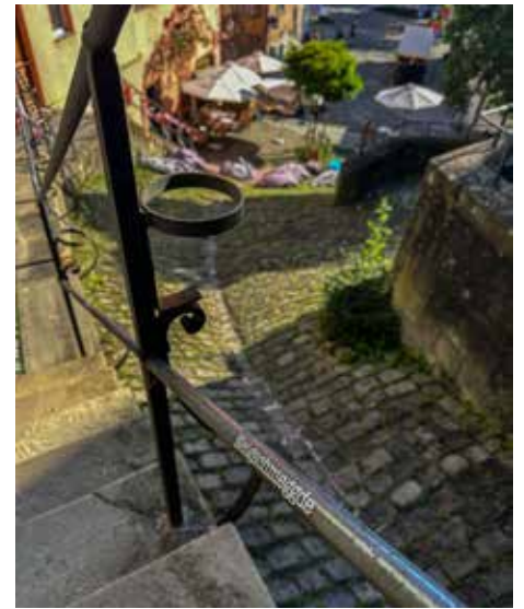
Worte als gedankliche Stolpersteine: Das Projekt "Fundworte" ist noch bis Oktober an der Nürtinger Zeppelinstaffel zu sehen.

werden. Noch bis zum 3. Oktober haben Passanten die Möglichkeit das Projekt zu betrachten, über die Begriffe und ihre Hintergründe nachzudenken, Zusammenhänge herzustellen und ihrer Kreativität freien Lauf zu lassen.