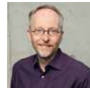
MdB Matthias Gastel