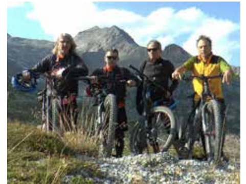
Das Bild zeigt das B-Team auf dem Pfitscher Joch in 2276 m.