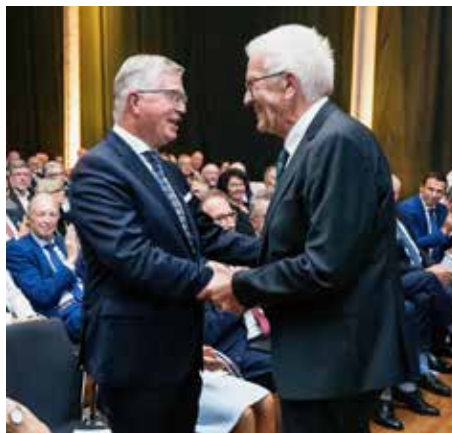
Verabschiedung Landrat Eininger Winfried Kretschmann

Mit einem Festakt des Landkreises Esslingen ist Landrat Heinz Eininger offiziell aus seinem Amt verabschiedet worden. Ministerpräsident Winfried Kretschmann würdigte den Kommunalpolitiker als „klugen Demokraten“. Eininger geht nach 24 Amtsjahren als Landrat Ende September in den Ruhestand.