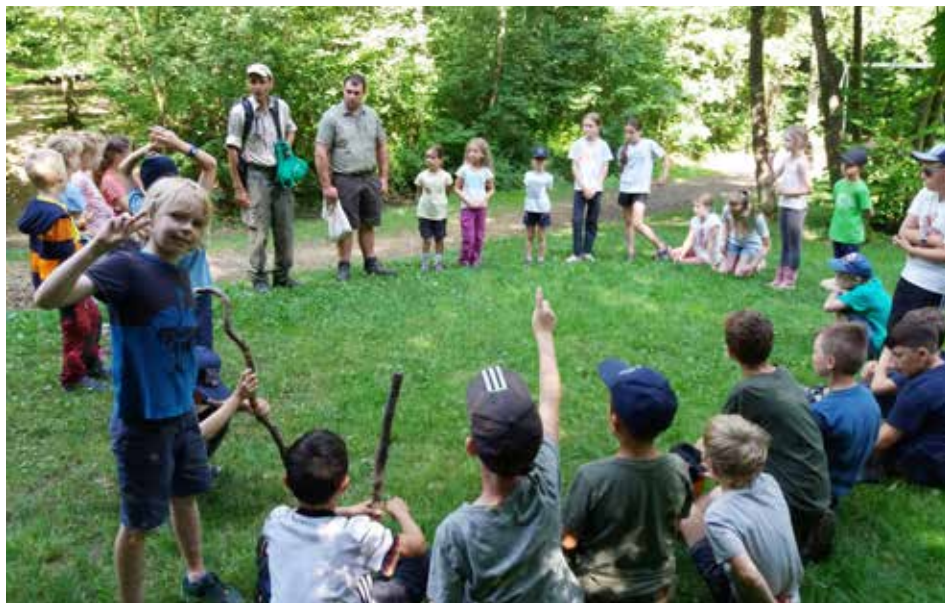
Mit dem Ranger unterwegs

In der letzten Woche verwandelten die Kinder die Räume der Kernzeitbetreuung in ein Familienhotel, wo fleißig eingedeckert, Betten belegt, Zimmer bezogen und das Hotelrestaurant besucht wurde. Auch ein Ausflug mit dem Bus zum Haldenhof und anschließendem Besuch des Maislabyrinths stand auf dem Programm, bevor am letzten Tag das DLRG zu einer Vorführung zum Mitmachen ins Freibad einlud.