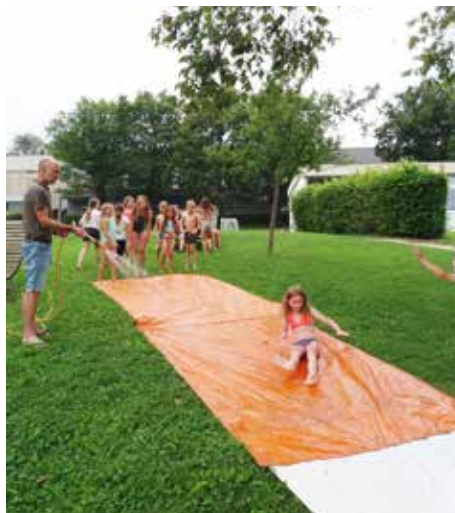
...und abwärts gehts!

Auch dieses Jahr gab es in den ersten 3 Ferienwochen eine Betreuung für alle Kinder der Kernzeit. Die erste Woche verbrachten alle Kinder komplett im Wald am Schelmenwasen. Die Kinder hatten eine Menge Spaß beim gemeinsamen Spiel im Wald und am angrenzenden Spielplatz. An einem Tag kam das Ökomobil des Landes Baden-Württemberg und zeigte den Kindern was alles so wächst und lebt in den Wiesen der Umgebung. Außerdem kam ein Ranger vorbei, der erklärte, welche Bäume im Wald wachsen, wie sie heißen und woran man sie erkennt.