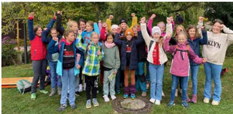
Weibliche E-Jugend in Tripsdrill Die Handballabteilung

Jetzt freuen wir uns auf den Start der neuen Saison!