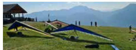
Startplatz auf der Emberger Alm

Zum Podest reicht's noch nicht ganz. Zum respektablen 15. Platz reichte es Klaus Renz bei den Offenen Internationalen Holländischen Meisterschaften in Greifenburg/Kärnten. In der letzten Woche trafen sich 38 Piloten zum Wettbewerb im Drachenfliegen.