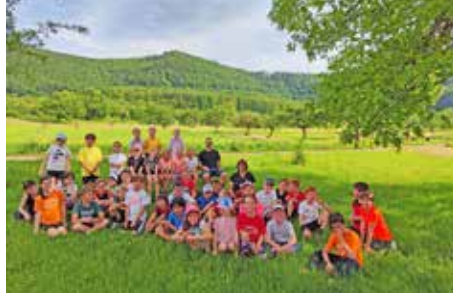
Streckenbesichtigung am 05.06.2024