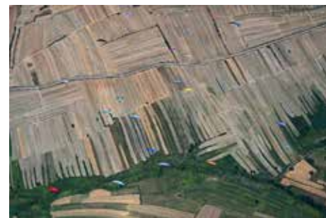
Das Rennen aus der Luft

Aber auch harter Sport. Bei den Internationalen Deutschen Meisterschaften in Krusevo in Nord-Mazedonien stellten das Reiner Braun, Heinrich Bretz und Peter Nägele, Piloten des DC-Hohenneuffen, eine Woche lang unter Beweis. Bei hochsommerlichen Temperaturen und Flughöhen bis zu 3000m flogen sie mit 135 weiteren Teilnehmern aus 24 Ländern täglich um den Tagessieg und letztlich um die Trophäe.