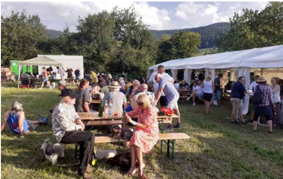
Der Festplatz füllt sich

IBAN DE08 6115 0020 0103 3593 11, Kreissparkasse Esslingen-Nürtingen IBAN DE96 6129 0120 0126 5280 04, Volksbank Mittlerer Neckar eG