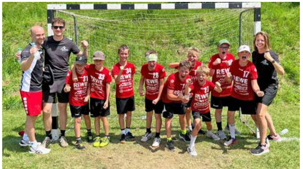
Männliche E-Jugend beim SV Cup