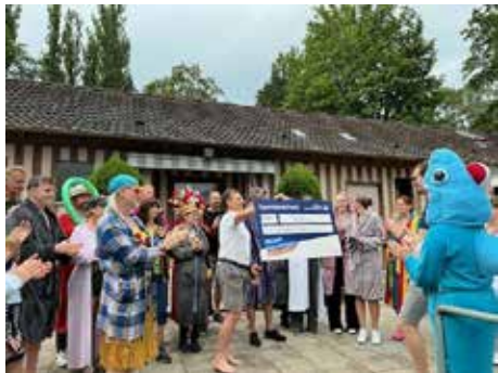
Scheckübergabe EURO 1000,- vom Schwäbischen Albverein Ortsgruppe Neuffen

Zwischenzeitlich hat es sich bestimmt bereits herumgesprochen, um was es dabei ging und insbesondere wie lustig es zuzuging. Vorankündigung für 2025: Wir wollen es wieder machen - mal sehen wie's bei Topwetterlage wird. ... und dann gab es nach der Prämierung und den Preisen noch ein besonderes Highlight: